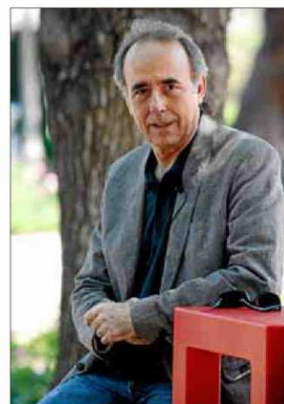
Joan Manuel Serrat.