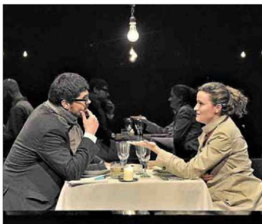
Escena de 'Coses que dèiem avui', que dirigió Julio Manrique.